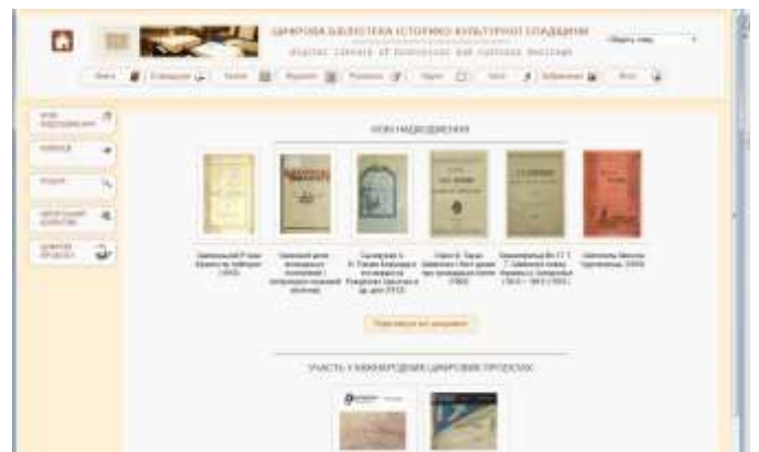
Каталоги бібліотек установ Національної академії наук України