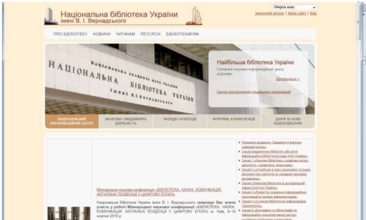
Національна бібліотека України ім. В. І. Вернадського надає доступ до електронних продуктів на платформі EBSCO